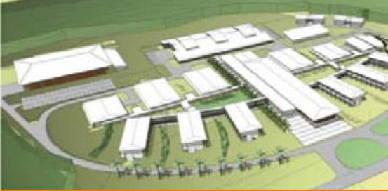
Lycée de Saint-Laurent de Maroni - Guyane