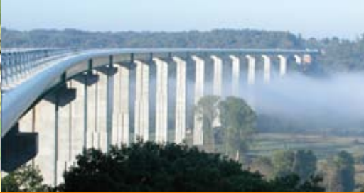
Liaison autoroutière A28 entre Rouen et Alençon