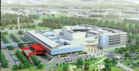
Centre hospitalier Pierre Oudot Bourgoin Jallieu