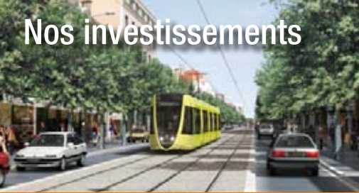
Tramway de la Communauté d'Agglomération Rémoise