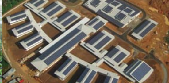
Lycée de Mana - Guyane

Le FIDEPPP, Fonds d'Investissement et de Développement des Partenariats Public-Privé, est l'instrument des Caisses d'Épargne qui investissent en France dans toutes les formes de partenariat public-privé (PPP) dans lesquelles une société privée finance, construit ou exploite un équipement ou une infrastructure publique.