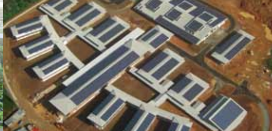
Lycée de Mana - Guyane

Le FIDEPPP, Fonds d'Investissement et de Développement des Partenariats Public-Privé, est un véhicule permettant aux investisseurs – les Caisses d'Épargne – d'investir en France dans toutes les formes de partenariat public-privé (PPP) dans lesquelles une société privée finance, construit ou exploite un équipement ou une infrastructure publique.