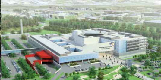
Centre hospitalier Pierre Oudot Bourgoin Jallieu