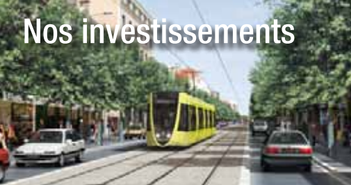
Tramway de la Communauté d'Agglomération Rémoise