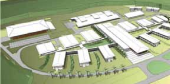
Lycée de Saint-Laurent de Maroni - Guyane