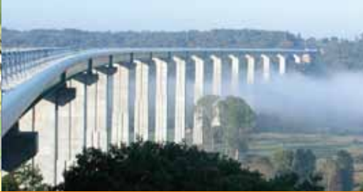
Liaison autoroutière A28 entre Rouen et Alençon